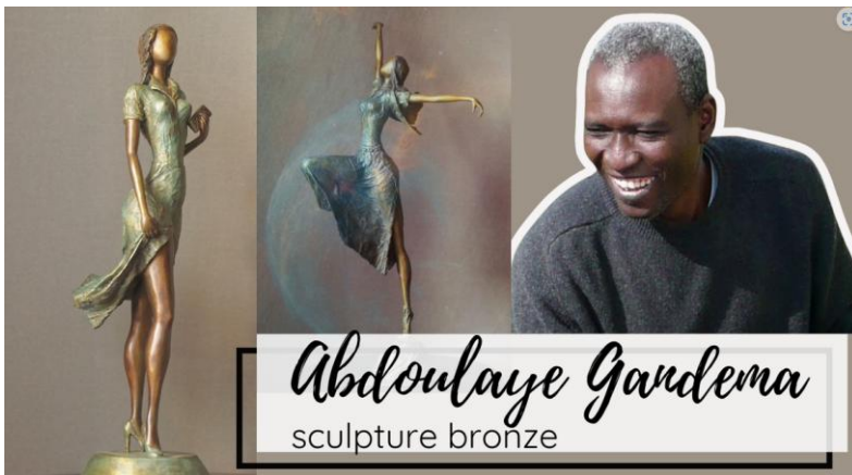
Abdoulaye Gandema sculpture bronze

https://www.facebook.com/christian.eurgal.5