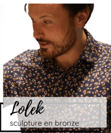
Lolek sculpture en bronze

Artiste précoce, il compose ses premiers dessins et pastels à 10 ans et propose ses premiers bronzes en exposition à 12 ans.