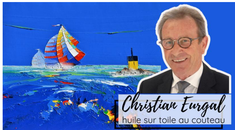
Christian Eurgal huile sur toile au couteau

Christian Eurgal est un artiste contemporain français. Les paysages abstraits d'Eurgal évoquent un horizon sans fin au-dessus des vagues ensoleillées. Ses peintures à l'huile, empreintes d'exotisme et de décors familiers, étirent des instants éphémères et nous invitent à arrêter le temps. Ils donnent à la nature un attrait romantique en utilisant des gammes de couleurs riches ainsi que des contrastes. Le peintre choisit des toiles bleues ou des endroits où la lumière est omniprésente et utilise des capacités de composition exceptionnelles pour créer un grand premier plan. Eurgal souligne son affinité pour la fraternité et son désir de liberté.